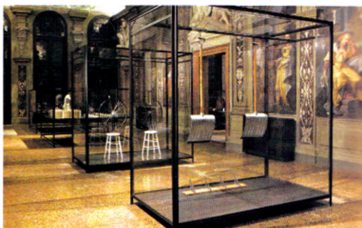
The Small Utopia. Ars Multiplicata

CARLO SCARPA. VENINI 1932-1947/ Una retrospettiva riservata a un maestro e agli anni della sua direzione alla vetreria Venini (foto, vaso a fasce applicate, 1940). Apre così il nuovo spazio espositivo della Fondazione Cini, Le Stanze del Vetro, nell'ex Convitto dell'Isola di S. Giorgio. Dal 29/8 al 29/11, www.lestanzedelvetro.it (P. B. -F.M.)