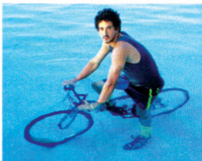
Pesci fuor d'acqua